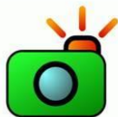
Premio fotografía fundacion io