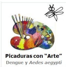
Picaduras con "Arte" Dengue y Aedes aegypti

Colabora con nosotros info@fundacionio.org