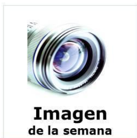
Imagen de la semana