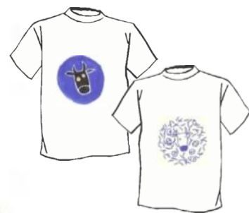
Camisetas disponibles en la TIENDA web ¡PIDE LA TUYA!

Donativos: Nº cuenta 3058 1915 97 2720023051 NIF: G-85750438