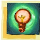
Concurso Dx a primera vista