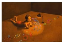
II Premio de Patología Infecciosa Fundación io