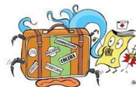
III Curso de Medicina Tropical y del Viajero para Atención Primaria