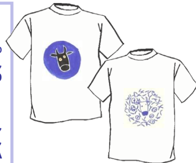
Camisetas disponibles en la TIENDA web ¡PIDE LA TUYA!

El tratamiento fiscal para los donativos realizados por personas jurídicas, establecido en la LEY 43/1995, de 27 DE DICIEMBRE del impuesto de sociedades, INCLUYE UNA DEDUCCION DE LA CUOTA INTEGRAL DEL 35% DE LA BASE DE LA DEDUCCION , pudiéndose aplicar esta los diez años inmediatos y sucesivos. La base de esta deducción no podrá exceder del 10% de la base imponible.