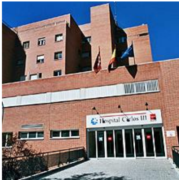
El Hospital Carlos III Sede del curso

La Fundación Io desarrolla Proyectos de lucha y control de Enfermedades Infecciosas en el tercer y primer mundo. Buscando la transformación y mejora de las comunidades más desfavorecidas . Sensibilizando a la población y combatiendo todas las Enfermedades Infecciosas, incluida la Injusticia.