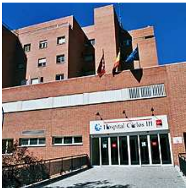
El Hospital Carlos III Sede del curso

La Fundación Ió desarrolla Proyectos de lucha y control de Enfermedades Infecciosas en el tercer y primer mundo. Buscando la transformación y mejora de las comunidades más desfavorecidas . Sensibilizando a la población y combatiendo todas las Enfermedades Infecciosas, incluida la Injusticia.