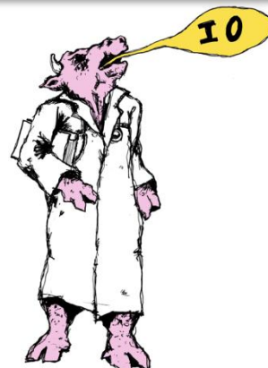
Vaquita io según Ginés