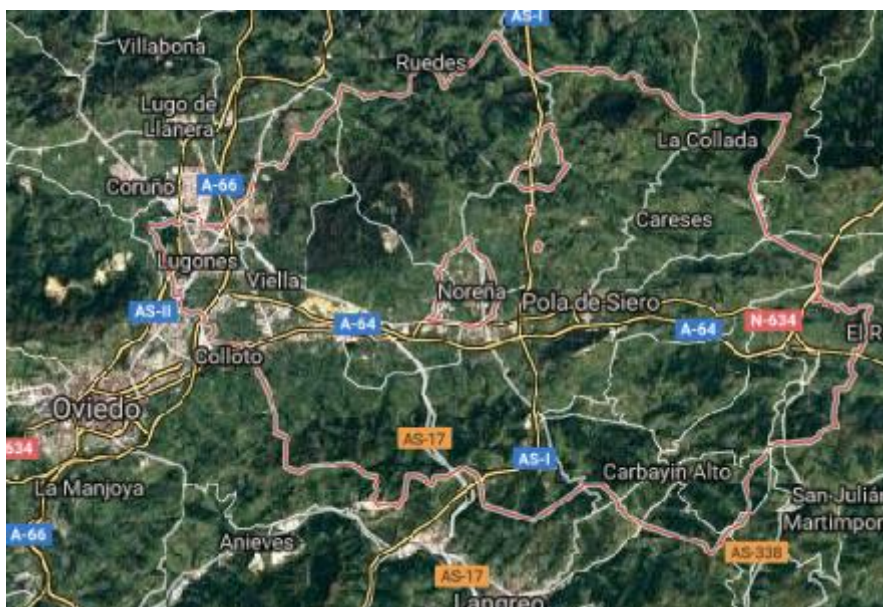
Figura 1. Localización geográfica de la zona donde se identificó el vector Aedes japonicus . Siero, Asturias, julio de 2018.

El 8 de junio de 2018 se recibió en la plataforma Mosquito Alert la fotografía de un mosquito procedente de una zona del concejo de Siero, en el Principado de Asturias. El equipo de entomología de la plataforma solicitó más información al ciudadano que había enviado la fotografía. Esta persona remitió al equipo larvas y un ejemplar de adulto en buen estado que permitieron confirmar, el día 10 de Julio, la pertenencia de algunas de las larvas y el ejemplar adulto a la especie Ae. japonicus . Esta identificación ha sido confirmada también sobre fotografías por el Dr. Francis Schaffner, especialista de referencia para mosquitos invasores en Europa.